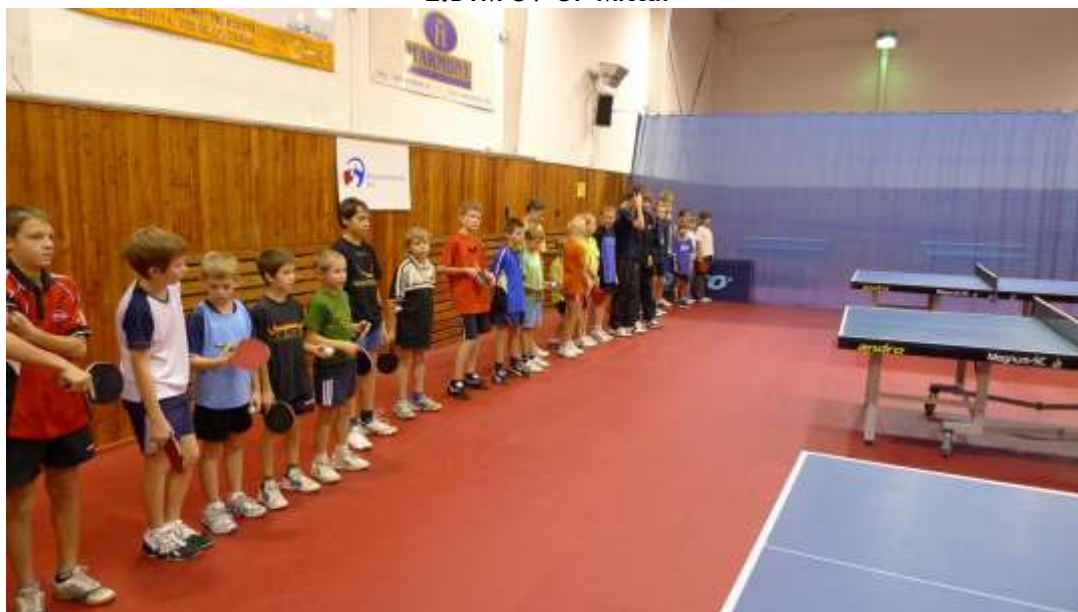
Boje nejmenších 2.BTM Mittal