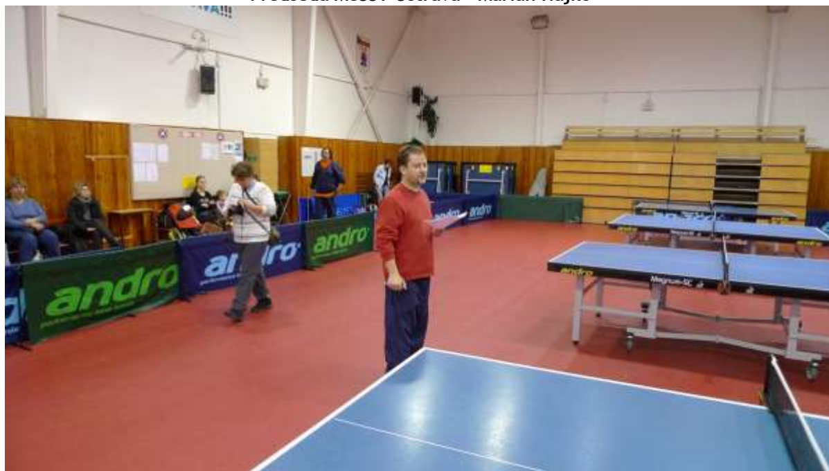
Rozhodcovský stůl v obležení 1.BTM OV-OP Darkovice